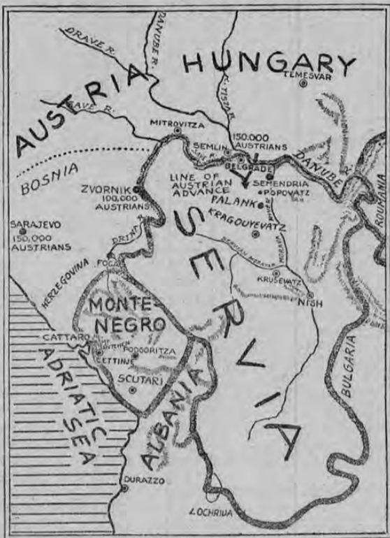
Este mapa muestra el campo por donde Austria invadió a Servia y su supuesta línea de avance al Sur del Nish, la nueva capital. De los 500.000 soldados austro-húngaros que hay actualmente en pie de guerra contra Servia, 150.000 operan desde la base de Semlin, 100.000 con su base en Czervonik en el río Drina, 150.000 tienen por base a Sarajevo y 100.000 tienen su base en Milanovatz en el Danubio.

NEW YORK, 21. — La compañía comercial notifica que el cable directo a Tokio está interrumpido.