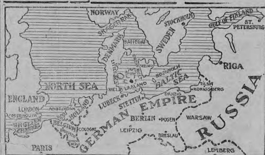
Este mapa indica el lugar donde las flotas de Inglaterra, Alemania y Rusia se han concentrado y donde indudablemente ocurrirá el más grande encuentro naval de la actual tragedia. Las flotas en estos mares se dividen así: Inglaterra 29 acorazados, 4 cruceros de combate y 13 cruceros armados con el "Iron Duke" de buque insignia; Alemania, 25 cruceros y 4 cruceros de combate con el "Friederich der Grosse" como buque insignia; Rusia, 4 cruceros y 4 cruceros de combate.